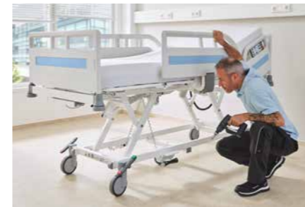
▲ Das wartungsarme Evario one erleichtert die Arbeit der Haustechniker