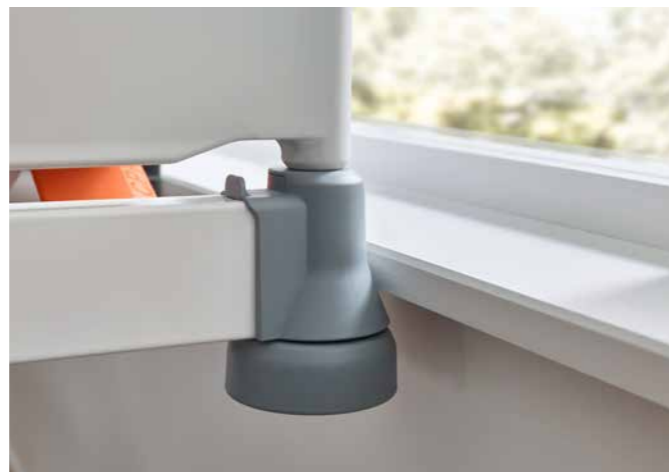
▲ Wandabweiskegel und -rollen minimieren das Schadensrisiko bei Kollisionen whrend des Fahrens und der Hhenverstellung.