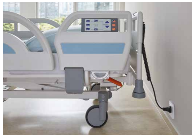
▲ Das optionale Bremssignal verhindert, dass ein ungebremstes Bett beim Wegrollen den Stecker aus der Wand reit.

Power aus Dänemark – in unseren Krankenhausbetten verbauen wir hochwertige Antriebe von LINAK, dem international führenden Anbieter von elektrischen Motorenlösungen für Betten und Möbel. Bei LINAK werden alle Produkte gründlichen Prüfungen unterzogen und entsprechen internationalen medizinischen Normen. Zugleich verbrauchen sie nur wenig Energie, sparen Kosten und schützen die Umwelt.