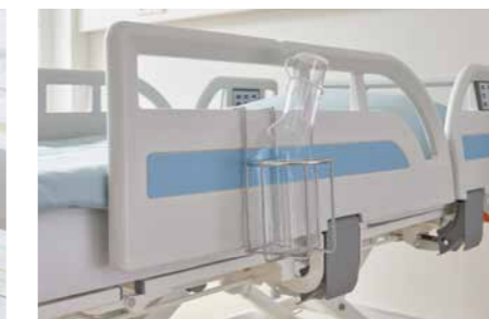
▲ Der Urinflaschenkorb lässt sich einfach an die Kunststoffseitensicherung hängen.