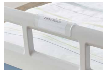
▲ Ein Namensschild erleichtert die Ansprache des Patienten. Ringsum am Bettumbau lassen sich Normschienen anhängen.