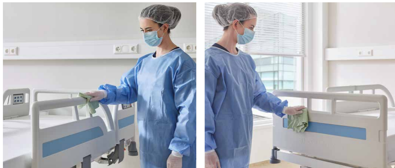
▲ Keine unzugänglichen Nischen an Häuptern und Seitensicherungen.

Eine sichere, validierbare Hygiene ist in Pandemie-Zeiten unverzichtbarer als je zuvor. Das Evario one erleichtert dem Hygiene-Team die manuelle Aufbereitung durch sein nischenarmes Design. Es spart Zeit, körperliche Anstrengung und personelle Ressourcen.