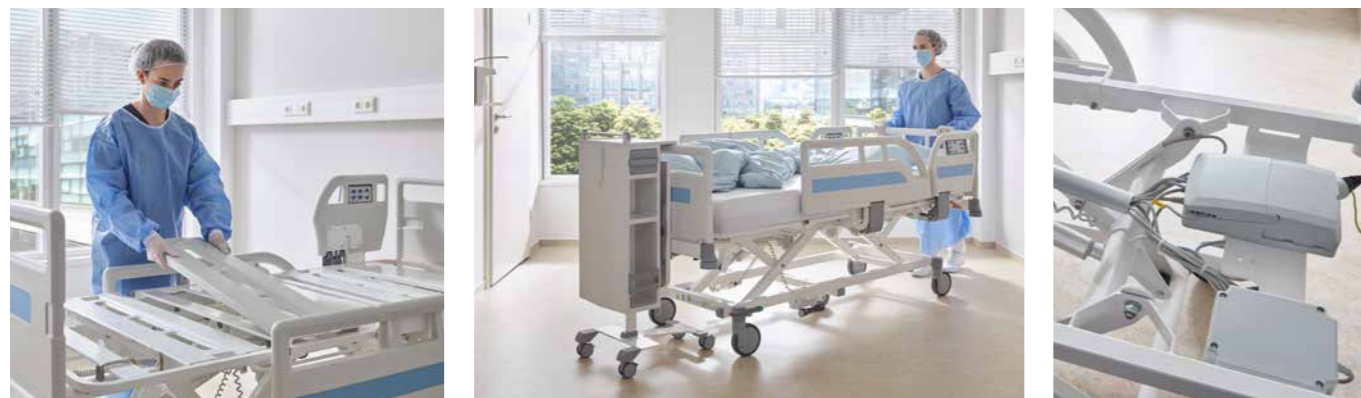
▲ Ebene Liegefläche mit einfacher Entnahme der Kunststoffabdeckung.