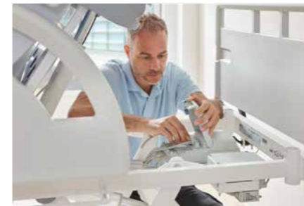
▲ Die Steuerung und der Akku sind leicht zugänglich am Kopfende des Bettes platziert.