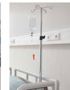
◀ Infusionsständer ermöglichen eine präzise Versorgung.