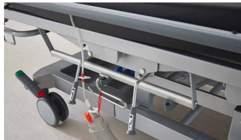
▼ Eine Ablage am Untergestell bietet Stauraum für eine Sauerstoffflasche inklusive Gurt und für persönliche Gegenstände des Patienten.

▼ Wichtiges Versorgungszubehör kann beim Mobilo beidseitig und variabel an den Versorgungsschienen angebracht werden.