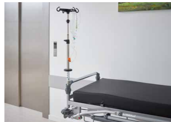
▲ Die optional erhältlichen Infusionsständer sind 2-fach teleskopierbar und können an allen 4 Ecken des Stretchers montiert werden.

Alle zur Behandlung notwendigen Versorgungselemente können leicht, sicher und schnell am Mobilo installiert werden. Dadurch lassen sich die Nutzungsmöglichkeiten als Stretcher oder Tagesliege flexibel ausschöpfen.