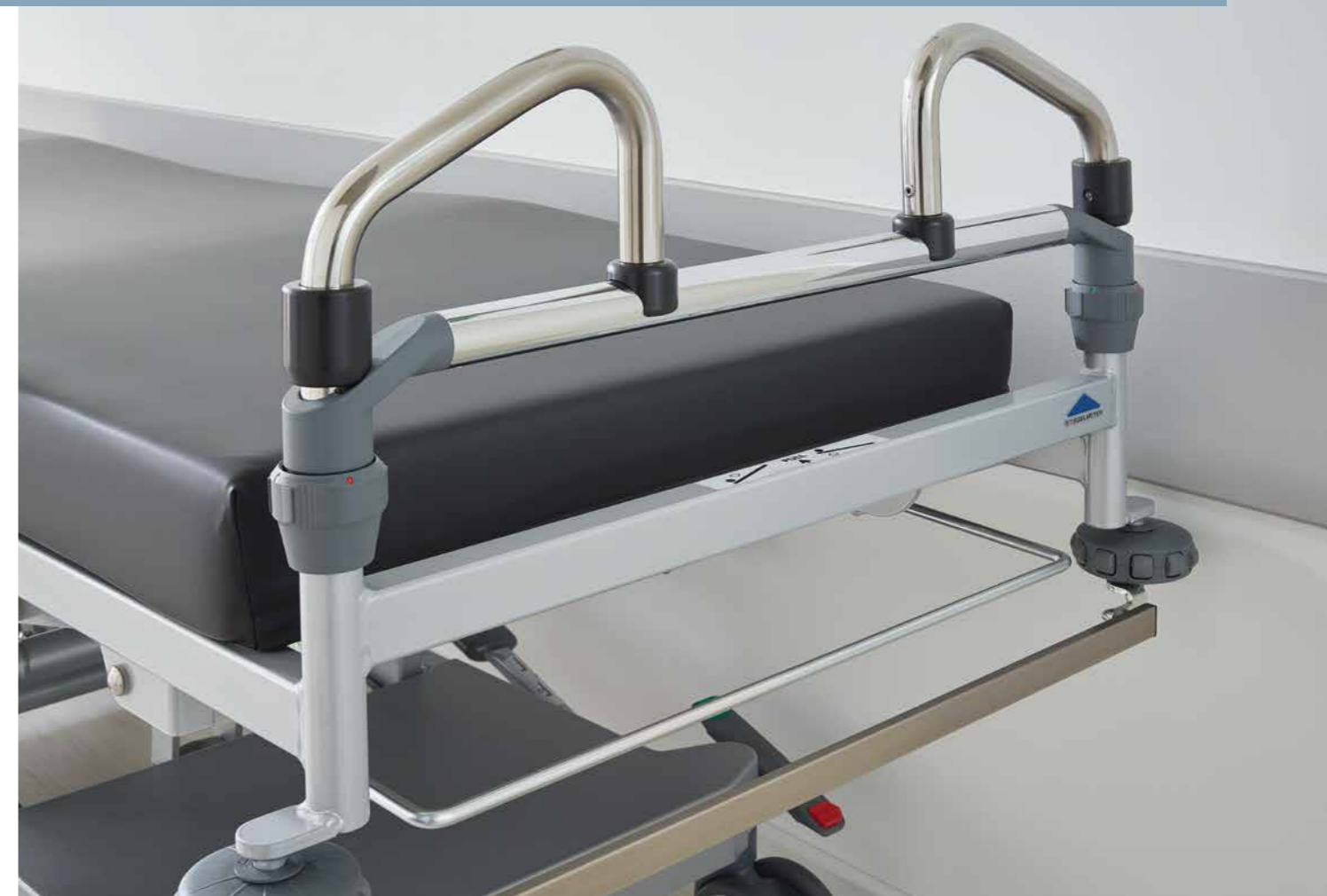
▲ Die breiten, ergonomisch geformten Schiebegriffe am Kopf- oder Fußende erleichtern das schnelle und wendige Manövrieren des Stretchers.