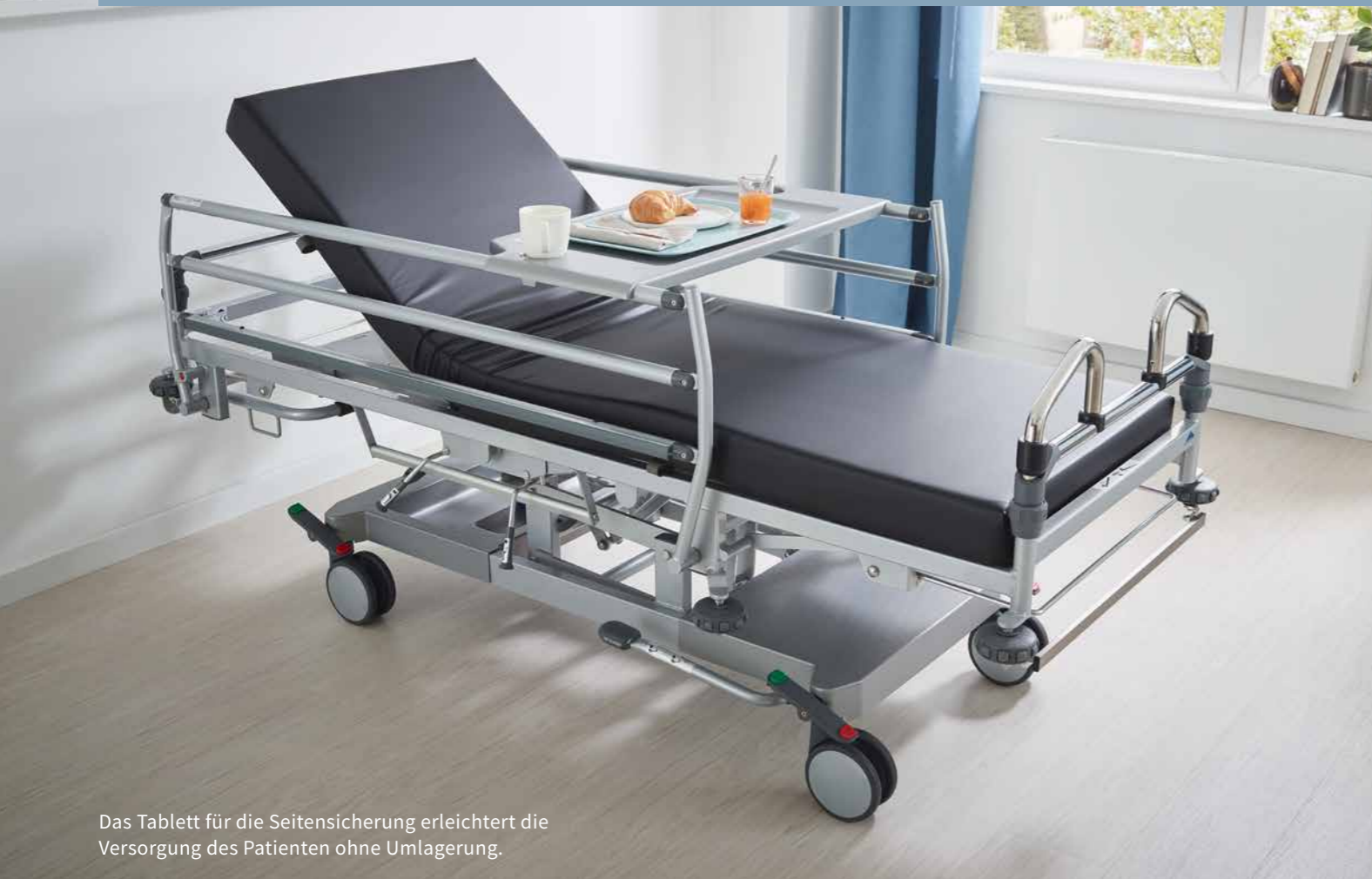
Das Tablett für die Seitensicherung erleichtert die Versorgung des Patienten ohne Umlagerung.